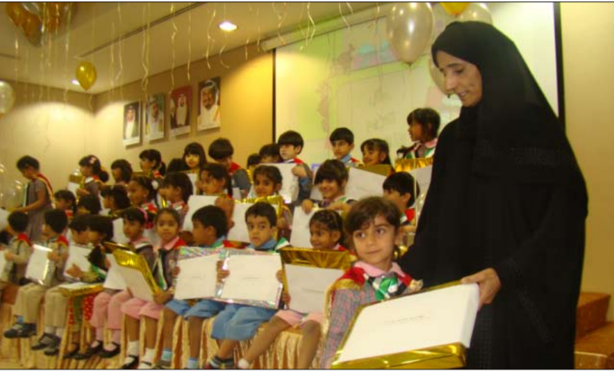
الحميدة وثمنت جهود ادارة الروضة والهيئة التدريسية بها لحرصهم على استمرارية المشروع لما له اثر جميل في غرس القيم النبيلة والتمسك بتعاليم الدين الحنيف.

ولي العهد ورئيس مجلس امناء مؤسسه حميد بن راشد النعيمي الخيرية على توطيد الصلة بين المؤسسات والهيات ومد جسور قوية لدعم الفئات المستحقة من شرائح المجتمع وخاصة طلبة المدارس. وأعربت عن سعادتها لقاء الأطفال المشاركين في هذا المشروع ودعمهم للتمسك بأوامر الدين الحنيف والاستفادة من الأوقات في ذكر الله وإدراك أهمية حفظ القرآن الكريم وتعاليم السنة النبوية في الصغر وتعلم العلوم النافعة واكتساب الخصال