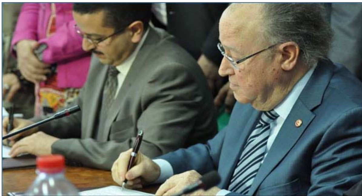
توقيع الرئيس والمقرر سبب الزوبعة