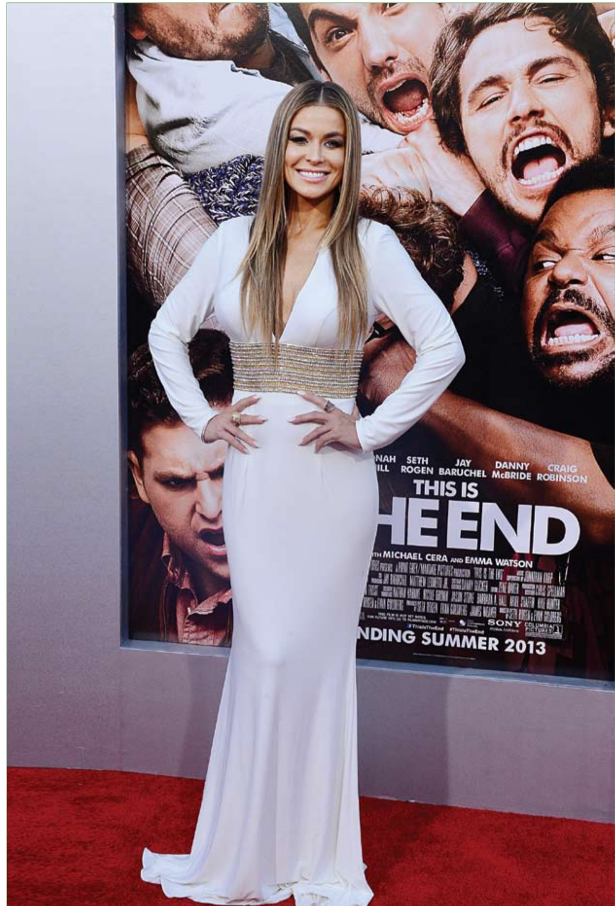
الممثلة والغنية كارمن الكترا خلال حضورها العرض الأول للفيلم الكوميدي (هذه هي النهاية)، في مسرح ريجنسي بلوس انجليس.

تحول حفل زفاف ليلة الأحد في مدينة الخيفرة بوسط المغرب إلى مكان لإسعاف الضيوف بعدما أصيب أكثر من 50 شخصاً بتسمم غذائي بسبب وجبة كسكس فاسدة نتفوا نتيجة لتناولها إلى المستشفى. وبحسب وكالة الأنباء المغربية الرسمية فإن نحو 55 شخصاً كانوا ضحايا تسمم غذائي، نتيجة تناولهم لطبق كسكس قدم خلال حفل الزفاف إذ تم إخضاع عينة من هذه الوجبة للتحاليل ونقلت الوكالة الرسمية المغربية عن مصدر طبي في المستشفى إنه تم نقل المصابين بالتسمم إلى مستشفى بالمنطقة، حيث أمضى من ثلاثة من المصابين بحالة التسمم الليلية فيه. ولم يعرف ما إذا كان العروسان من ضمن الذين أصيبوا بالتسمم ونقلوا إلى المستشفى أم لا.