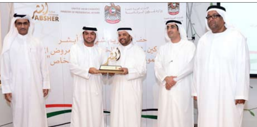
السامية التي أطلقها صاحب السمو رئيس الدولة وتحظى بتابعته من سمو الشيخ منصور بن زايد آل نهيان نائب رئيس مجلس الوزراء

وأوضح الظاهري أن برامج صيفنا مميّز تشمل فعاليات يوم التراث، ويتم فيه تدريب الطلبة في ورش متخصصة على التراث الوطني والتقاليد والقيم الأصلية لمجتمع الإمارات من خلال مدربين متخصصين، وتتعلم الطلبة خلال التدريب منظومة شاملة من هذه القيم في مقدمتها آداب المجلس وتوقير الكبار والتعلم من حكمتهم وخبرتهم واستقبال الضيوف وغيرها من الأمور التي سيحرص الطالب ثرات الآباء والأجداد، وآليات الحفاظ عليه، ورعايته.