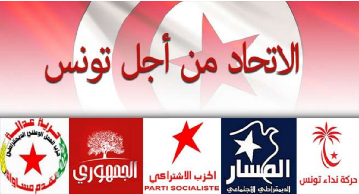
الاتحاد من أجل تونس